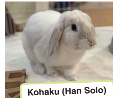
Kohaku (Han Solo) 琥珀(ハン・ソロ)

He's also found a favorite spot where he goes to rest when he's tired. Watching him lie there, sleepily licking his paws or the mat like a little baby, is so incredibly adorable that our whole family feels joy every single day. We are truly grateful to ARK for connecting us with such a wonderful family member as Kohaku. We will continue to look after him with all the love and care in the world so he can live a happy, peaceful life.