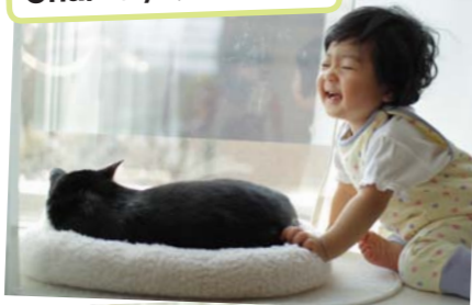
Charlie / チャーリー

Charlie, whom we adopted 16 years ago, was originally one of three brothers who came to ARK together. The others were named Sebastian and Figaro. Charlie's brothers went to my English teacher and he came to us.