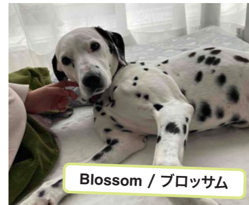
Blossom / ブロッサム

It hasn't even been a week since Blossom joined our family, but she is fitting in beautifully. For the first few days, she was so eager for affection that she couldn't even settle down for a nap. Now, she's finding her own rhythm, discovering her favorite spots, and even snoring away comfortably.