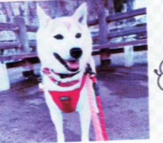
いつもお世話になっております。 023年5月6日にリホームしたマロウです。