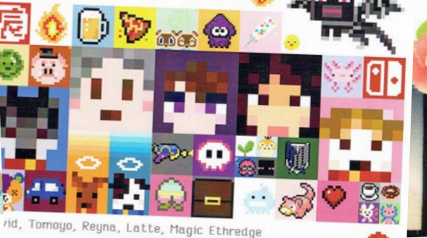
rid, Tomoyo, Reyna, Latte, Magic Ethredge