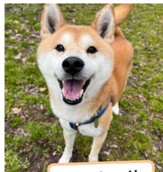
Eight / エイト 8 y ♂

遠い町からアークに移り、新しい環境にもきちんと適応してくれたヘムズリーに敬意を払うとともに、そんな彼を迎えてくださる方のご縁が1日でも早く訪れることを心から願っています。