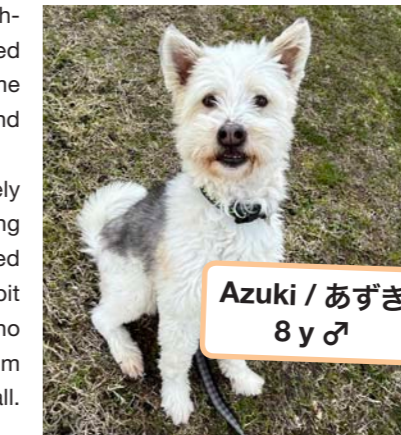
Azuki / あずき 8 y ♂

We’re hoping he will be reunited with his family very soon. We’ll look after him very well until that day comes.