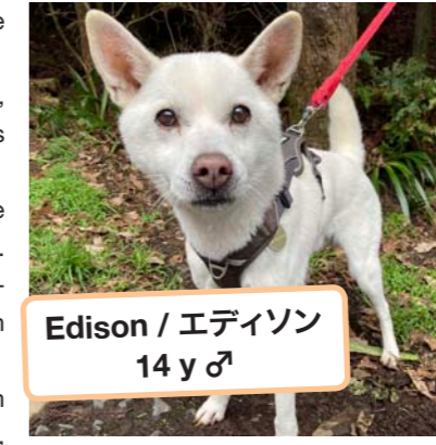
Edison / エディソン 14 y ♂

At 14, he’s an older dog and we truly feel for him having lived through a terrifying experience and the anxiety it must have caused. We hope he’ll feel happy and safe for the rest of his days.