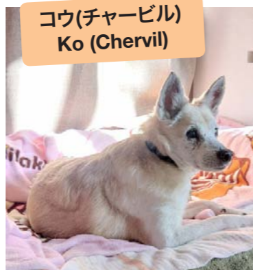
コウ(チャービル) Ko (Chervil)

He doesn't really like me, I think, because he rarely comes to me, but I think that's just the way he is and I find it charming. I want him to always remain true to himself. I'll update you again so on.