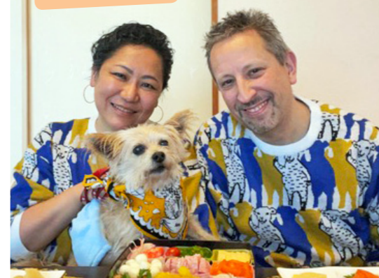
カール(ネオ) Carl (Neo)

Carl now has his own Instagram site. Thank you again for all your help.