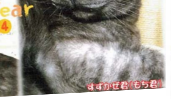
すずかぜ君(もち君)