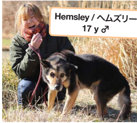
Hemsley / ヘムズリー 17 y ♂

Eight had a terrifying experience and then ended up away from his family; we know he must be really sad and anxious at times. We will take very good care of him until they come back for him. We’re hoping that day will come very soon.