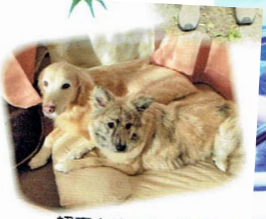
初春をめでたくお祝い申